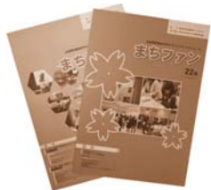
まちづくりファンドニュース「まちファン」