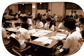
「高知市まちづくりファンド」公開審査会

2003年に高知市が創設した公益信託「高知市まちづくりファンド」の運営委員会、公開審査会、中間・最終発表会等の企画・運営を行い、まちづくりファンドニュース「まちファン」の企画・発行しています。また、市民との連携を深めながら、高知のまちづくりについて自由に語り合う「まちづくりトークcafe」を毎月開催しています。