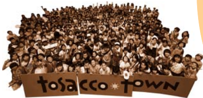
子どもが運営するまち「とさこタウン」