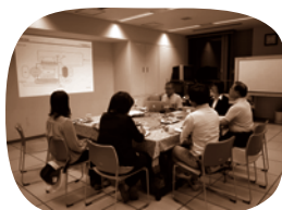
「まちづくりトークcafe」